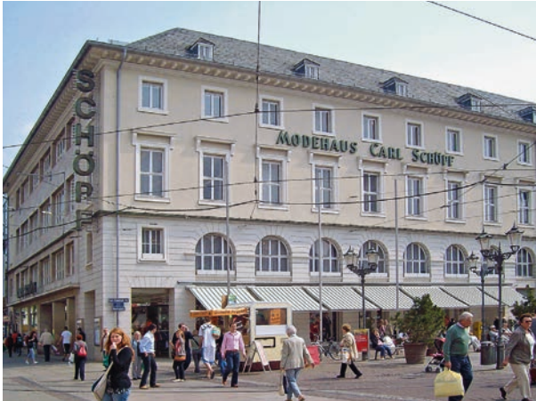
Das Modehaus Carl Schöpf am Marktplatz von Karlsruhe

ist das Modehaus Schöpf die erste Adresse. Besonders für Kinder und Jugendliche gibt es alles an festlicher Kleidung: Für Taufe, Kommunion, Konfirmation und sämtliche Familienfeste.