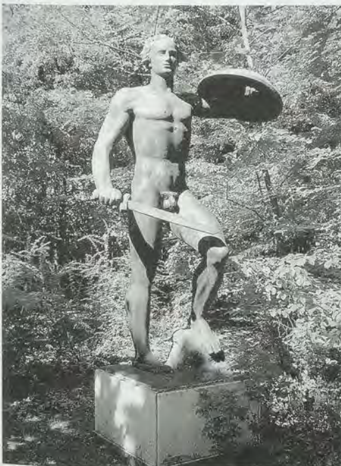
Kämpfer mit Schwert und Schild, Forstner-Kaserne Karlsruhe (1938)

Für die neue Chirurgische Universitätsklinik in Heidelberg schuf Sutor 1936 eine »Germanische Familie« unter einer Irminsäule, die »die Wiederbelebung der germanischen Mythologie« 19 zum Ausdruck brachte, und, noch im selben Jahr, für die Olympiade in Berlin einen »Hürdenläufer«, für den er eine Goldmedaille erhielt, und einen »Hockeyspieler«. Zu diesen »die körperliche Zucht verherrlichenden Kampfbildern« 20 passen dann, außer den monumentalen Kriegerdenkmälern in Forbach (1937) und auf der Reichenau (1938), die Werke, die die soeben erbaute Karlsruher