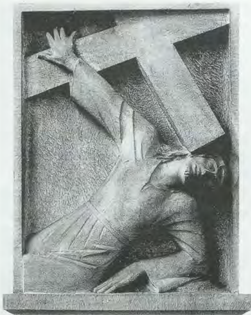
Kreuzwegstation, Dom Altenberg (1939)