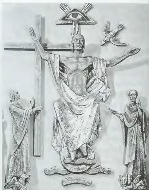
Chorwand (Ausschnitt), Christkönig Bad Meinberg (1954)

epischen Bildern, hin zum dramatischen Ausschnitt, der Jesus und allenfalls diejenigen, die ihm an den jeweiligen Stationen seines Weges begegneten, oft nur noch im Porträt zeigte; zu einem Ausschnitt, der derart ein »verknappter, verdichteter Ausdruck« 9 des Gesamtgeschehens war. Von einem solchen Künstler mochte man, auch wenn er nur hier und da Bedeutendes leistete, »noch Bedeutendes erwarten« 10 ; nämlich dass er Möglichkeiten und Gelegenheiten fände, »sich in Werken wahrhaft religiöser Größe und Tiefe weiter zu entfalten« 11 .