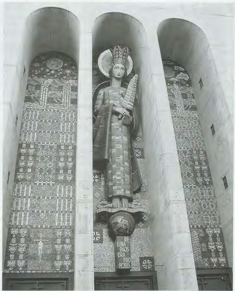
Portal der katholischen Frauenfriedenskirche in Frankfurt am Main, mit Marien-Großplastik als Fassadenschmuck (1928).

Mosaik umkleidet und erinnert zum einen an altkirchliche, byzantinische Bilder, an Ikonen, zum anderen aber auch an die exotischen Idole, für die sich die Expressionisten begeisterten. Ewald Mataré schuf, wohl unter ihrem Eindruck, 1932/33 eine ganz ähnliche Skulptur, einen hl. Thomas von Aquin; an ihrem ersten Standort in Berlin musste sie schon am Tag nach der Einweihung verhüllt und dann entfernt, an ihrem zweiten in Düsseldorf eingemauert werden; so sehr lehnte man sie, als zu modern, ab. 5 Eine an-