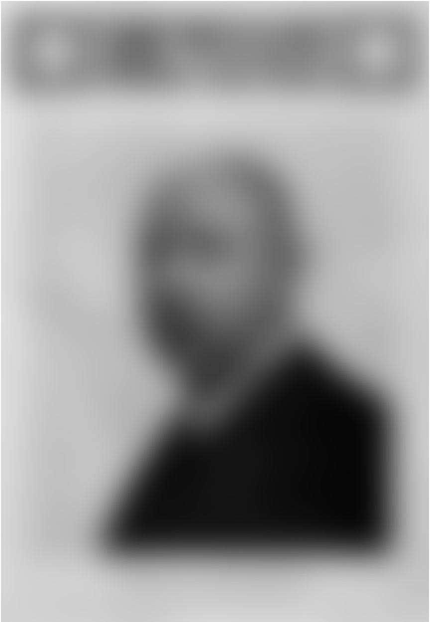
Abb. 1: Als badischer Staatspräsident wurde Anton Geiß auch überregional einer breiteren Öffentlichkeit bekannt. Die in Deutschland weit verbreitete Wochenzeitschrift „Die Woche. Moderne Illustrierte Zeitschrift“ widmete ihm in Heft 15 (1919) vom 12. 4. 1919 ein ganzseitiges Porträt.