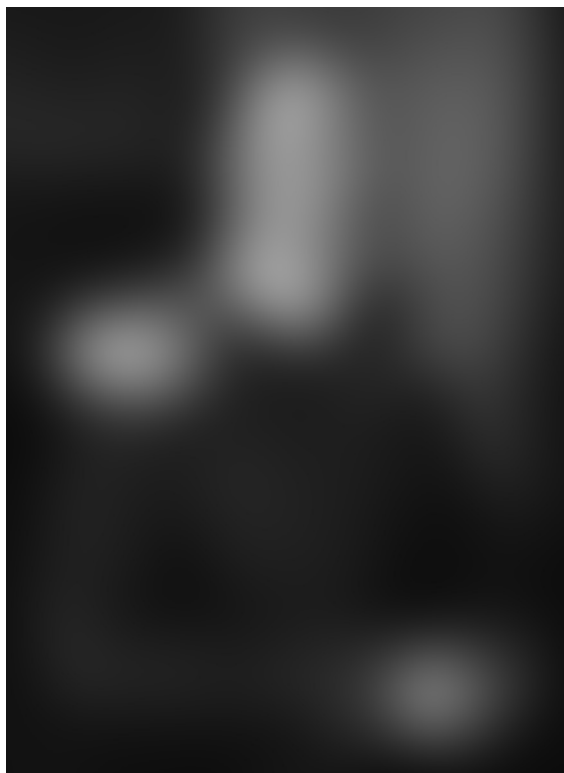
Abb. 5: Großherzog Friedrich II. von Baden (1857–1928), Großherzog von Baden 1907 bis 1918, Aufnahme aus der Zeit des Ersten Weltkrieges.

derholten Male für das Kriegsverdienstkreuz vorgeschlagen sei, und dessen Annahme meinerseits ganz bestimmt erwartet werde. Aber auch in diesem Fall habe ich es trotz des gütlichen Zuredens des Herrn Geheimrats 105 abgelehnt, diese Ehrung anzunehmen. Von da an wurden solche Ansinnen nicht mehr | an mich gestellt, und ich gab mich der Auffassung hin, daß ich nun für alle Zukunft von derartigen Dingen verschont sein werde.