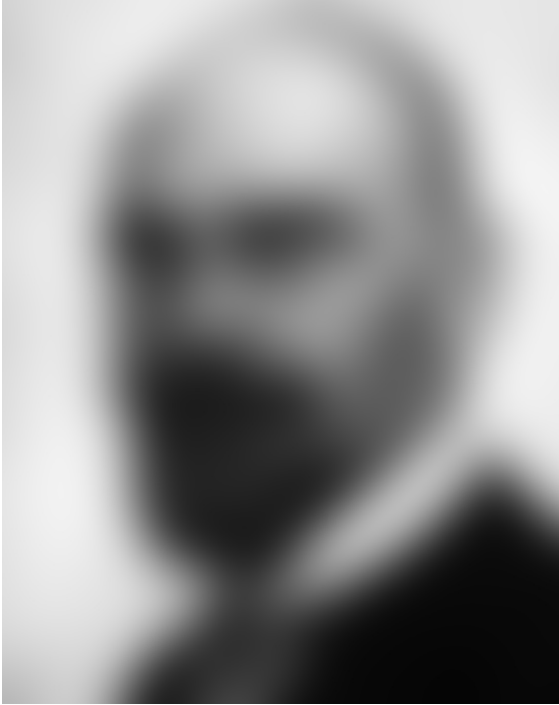
Abb. 14: Heinrich Köhler (1878–1949), 1919 Kabinettschef des Staatspräsidenten Anton Geiß; später u.a. badischer Staatspräsident und Reichsminister der Finanzen.

Landtagsabgeordnete und frühere Oberrevisor im Finanzministerium Staatsrat Heinrich Köhler berufen. Zu seinen Mitarbeitern wurde eine Anzahl tüchtiger, zuverlässiger Beamter, welche bisher in anderen Ministerien amtierten, berufen. Dieses Zentralbüro erhielt die Bezeichnung Staatsministerium.