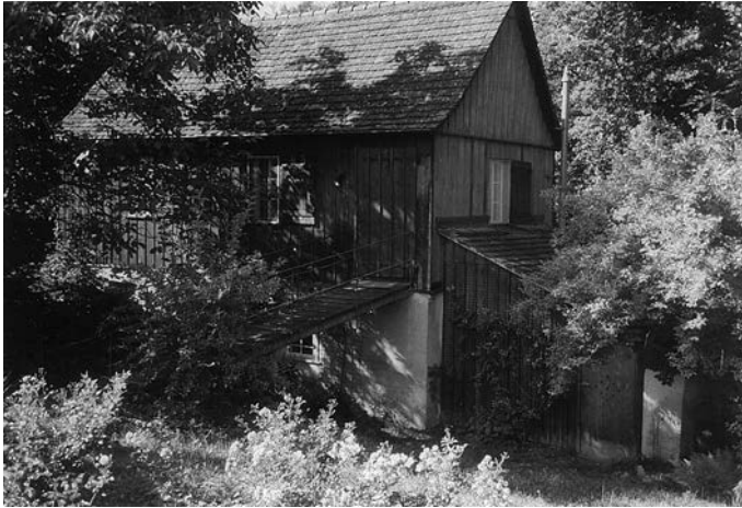
Gartenhaus mit Arbeitszimmer und Bibliothek beim Glaserhäusle Meersburg

schwiegen? Er kommt auch nicht in der dreibändigen Geschichte der Stadt Freiburg vor. Aber er ist auch nicht erwähnt in „Die Juden in Deutschland“ 34 und nicht in Willi Jaspers „Deutsch-jüdischer Parnass. Literaturgeschichte eines Mythos“ 35 Wie konnte FM auch von jüdischer Seite so ignoriert werden, dass man ihn erst lange nach dem Zweiten Weltkrieg wieder entdecken musste?!