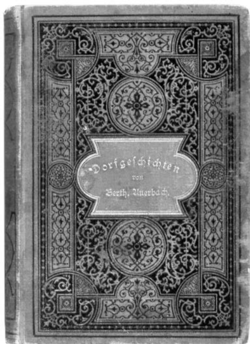
Berthold Auerbachs Sämtliche Schwarzwälder Dorfgeschichten. Volksausgabe in 8 Bänden. 3. Bd Stuttgart 1871.