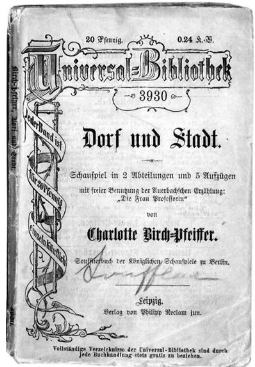
Textheft zum Bühnenstück Birch-Pfeiffers. Leipzig o. Jahr (um 1900). BLM Inv.Nr. 2003/1601

lässt sich bei allen späteren Bearbeitungen der Auerbachschen Erzählung beobachten, ob als Theaterstück, als Operette oder als Kinofilm.