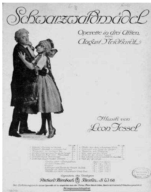
Klaviersatz zur Operette von Léon Jessel, Berlin 1917 mit Abbildung aus der Erstaufführung. BLM Inv.Nr. 98/70

matfilm lieferte als eigenes Genre eine regelrechte Zeitgeistabbildung. Das „Schwarzwaldmädel“ jedoch bildete kollektive Sehnsüchte nicht bloß ab, sondern bündelte und lenkte sie sogar. Es hat zur Konstruktion eines der jungen Bundesrepublik fehlenden Heimatgefühls ganz wesentlich beigetragen und löste die erste „Welle“ des deutschen Kinos aus: Eine Flut von nahezu 200 Heimatfilmen überschwemmte die Kinolandschaft der 1950er Jahre, und etliche weitere Filme wurden im Spielort des „Schwarzwaldmädel“ – in St. Peter und St. Märgen. Gezeigt wurden die „Heimatschinken“, wie Gegner dieses Filmformates witzelten, in plüschigen Kinosälen und monumentalen „Filmtheatern“. Von ihnen gab es 1955 allein in Westdeutschland die ungeheure Zahl von 6239 Stück.